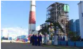
COLAPSA DE NUEVO EL SISTEMA ELÉCTRICO