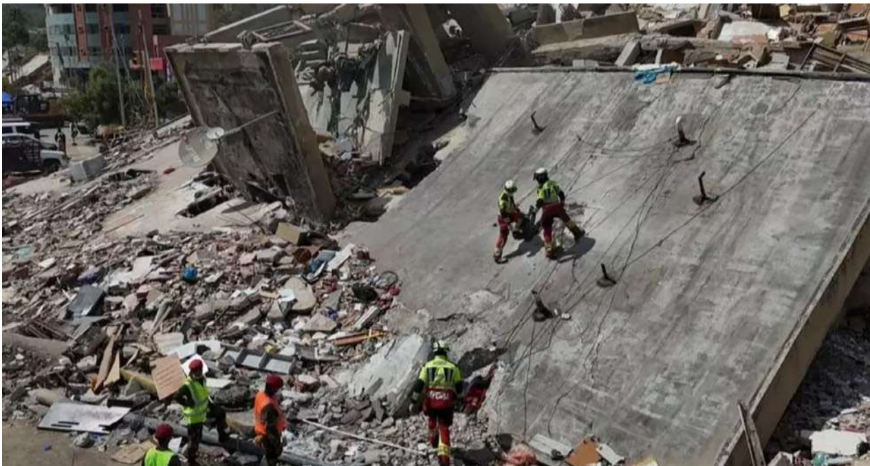
Labores de rescate en el edificio Coral Beach, donde fue hallado el cuerpo de Dayán Martínez.