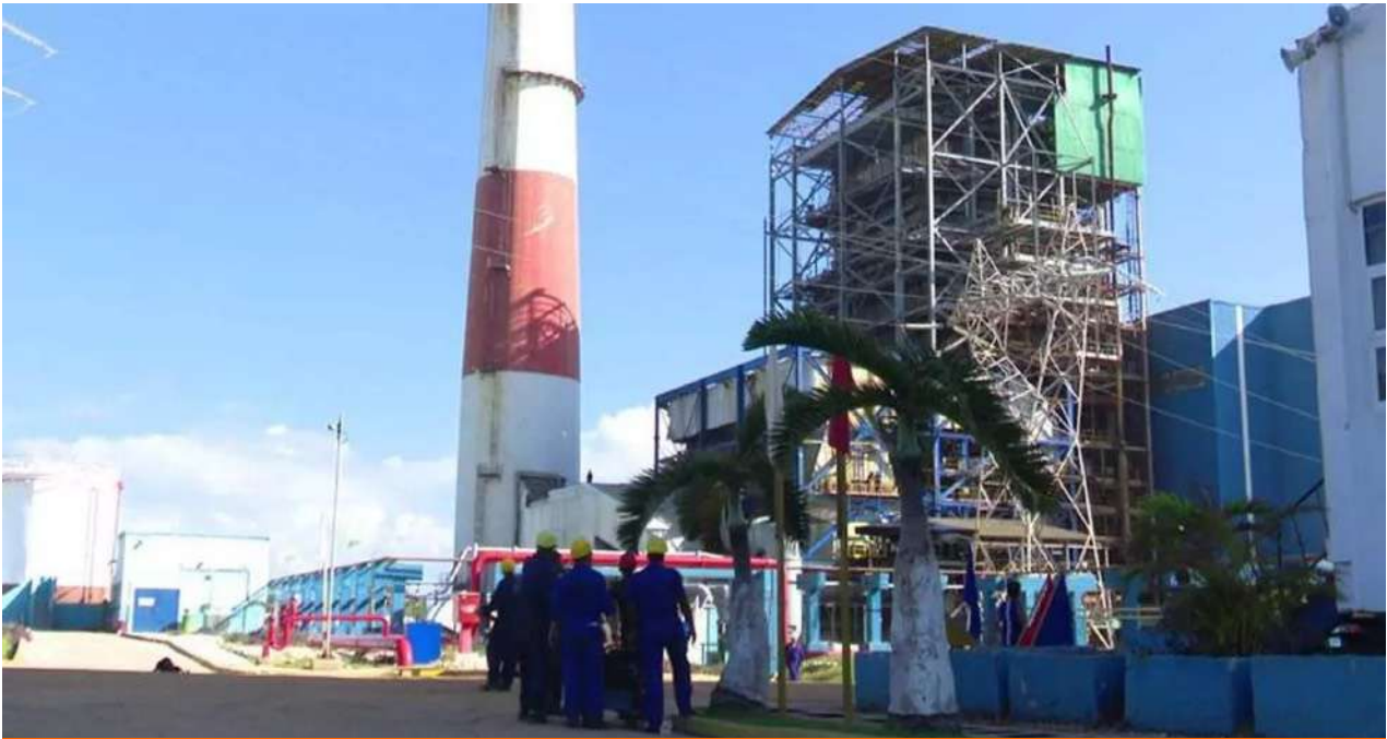
CTE Antonio Guiteras, en Matanzas, que sufrió el viernes una nueva salida del sistema.