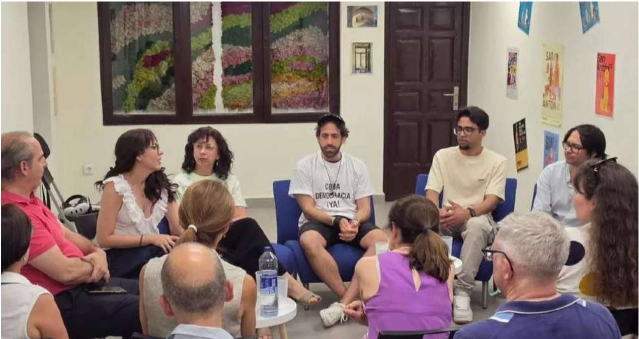
Conversatorio en Madrid por el quinto aniversario del 11J, con la participación de activistas, ex presos políticos y defensores de derechos humanos cubanos.