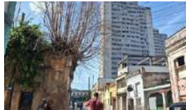
LOS LOCOS DEL APAGÓN, POR YOANI SÁNCHEZ