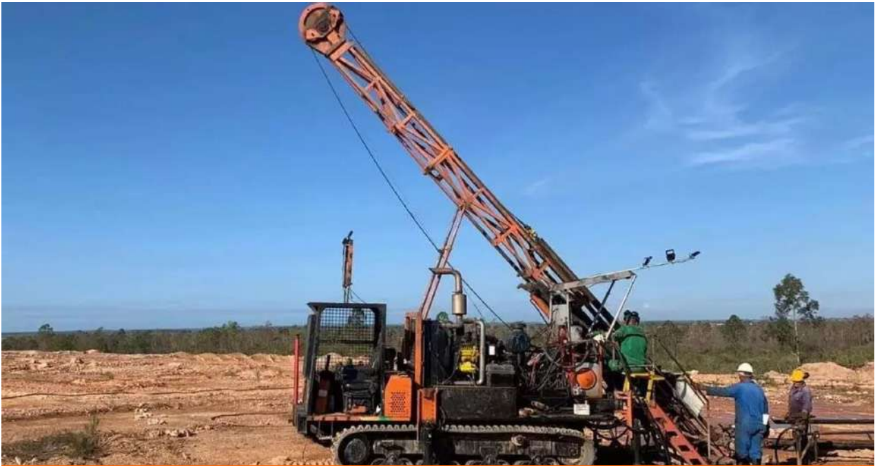
El área de la concesión El Pilar, en Ciego de Ávila, donde Antilles Gold proyecta explotar la mina Nueva Sabana.