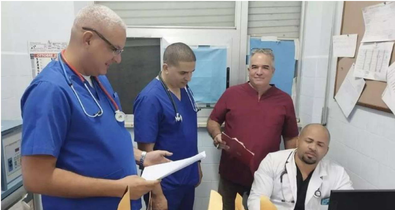
Grupo de médicos cubanos en el Hospital Gioia Tauro, Reggio Calabria en Italia.