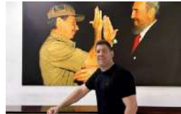
EL CANGREJO SE PRESENTA COMO NEGOCIADOR CLAVE