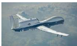
EE UU AUMENTA VUELOS MILITARES CERCA DE CUBA