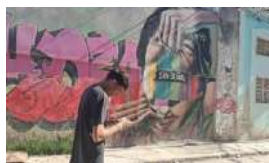
APUNTES PARA UNA TRANSICIÓN EN LA ISLA