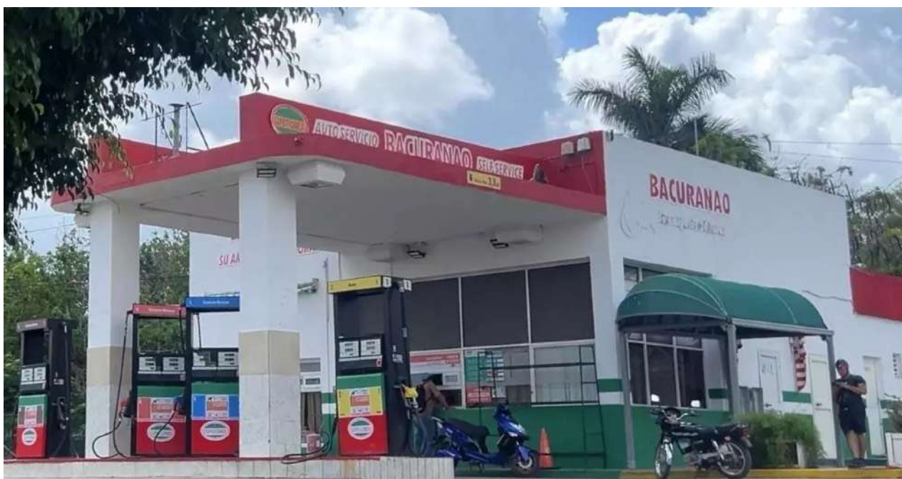
Las ventas del sector petrolero de EE UU a Cuba subieron de manera exponencial en marzo

Una selección con lo mejor de la semana del primer diario independiente hecho en Cuba