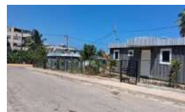
CASAS CON CONTENEDORES RECICLADOS