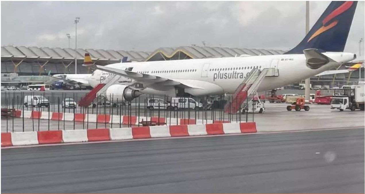
Avión de Plus Ultra en la pista del aeropuerto de Barajas, en Madrid.