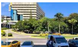
MELIÁ, PREOCUPADA POR LA HELMS-BURTON