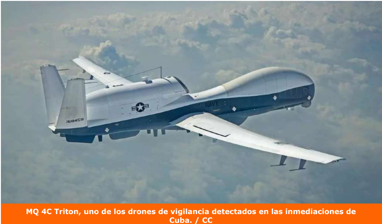
MQ 4C Triton, uno de los drones de vigilancia detectados en las inmediaciones de Cuba.