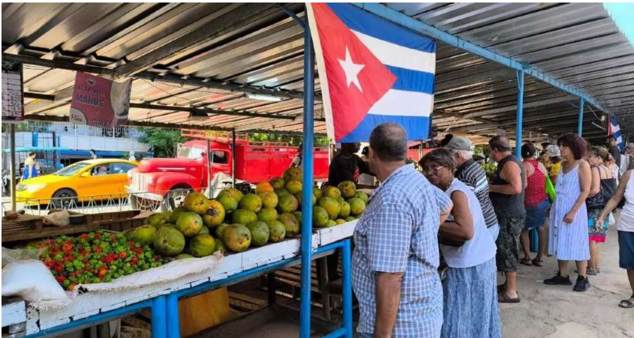
Cubanos comprando en un puesto de venta del mercado de 17 y K.