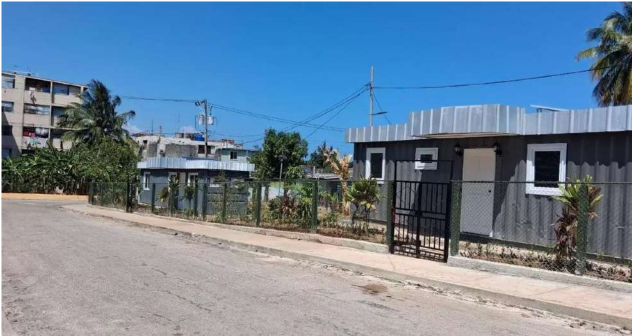
Vista de las dos nuevas viviendas contenedores en Nuevo Vedado.