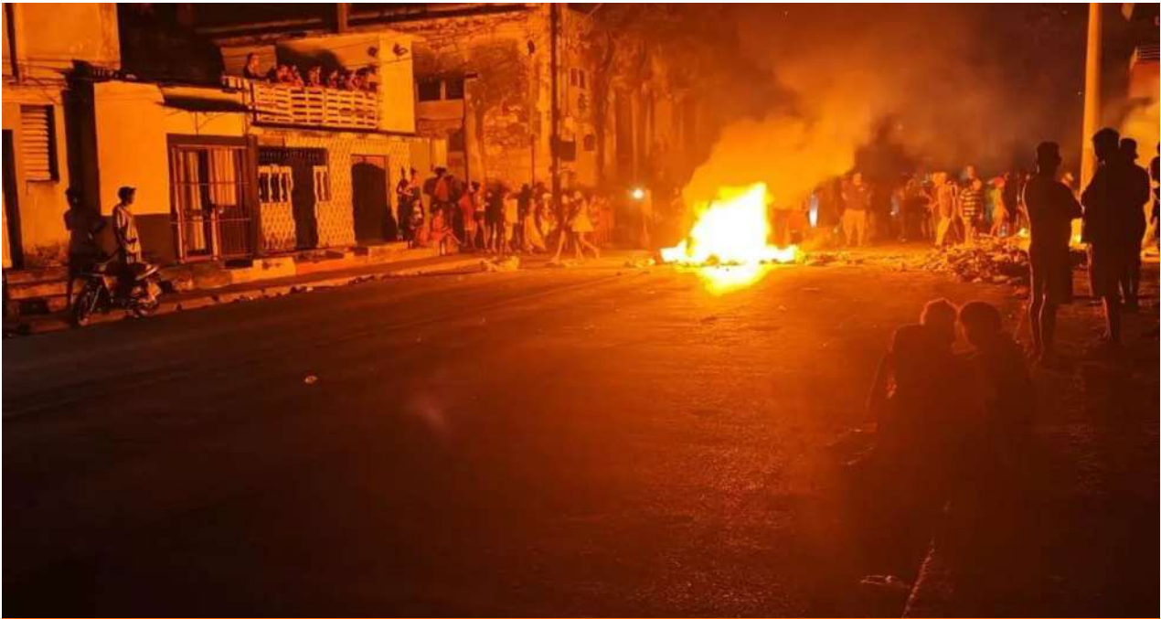
Manifestaciones en Marianao, La Habana, luego de más de 20 horas sin electricidad.