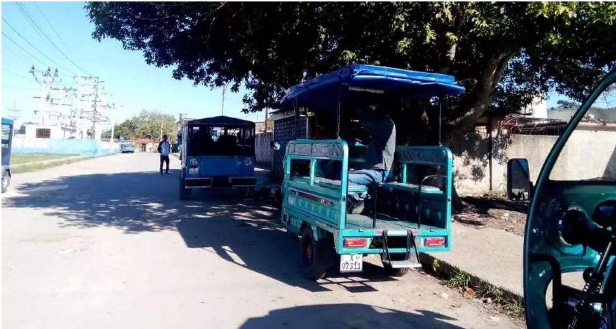
Triciclos en piquera de la antigua terminal de trenes de San José de las Lajas.