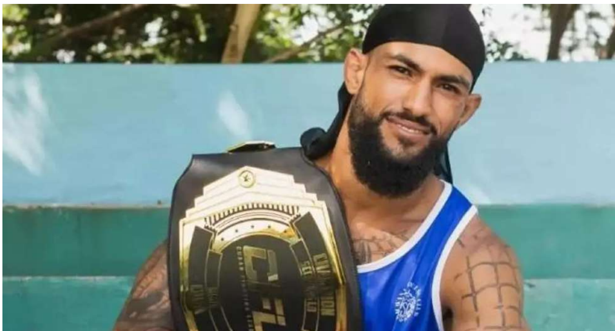
El campeón de artes marciales mixtas Javier Ernesto Martín Gutiérrez, conocido como 'Spiderman'.