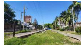
BAJO UN CIELO AZUL DE POSTAL, CUBA SE DESMORONA