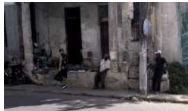
LA ECONOMÍA SE DESPLOMARÁ UN 6,5% EN CUBA