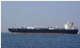
EL PETROLERO RUSO 'UNIVERSAL' CAMBIA DE RUMBO