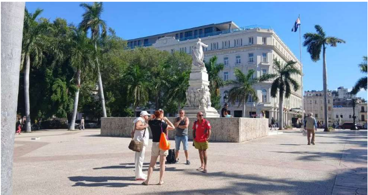
Un pequeño grupo de turistas rusos en La Habana el pasado 13 de febrero, justo cuando se anunció la cancelación de vuelos de ese país.

Una selección con lo mejor de la semana del primer diario independiente hecho en Cuba