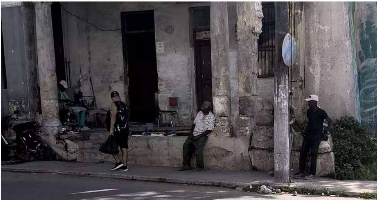
Ancianos vendiendo artículos en la avenida Diez de Octubre, de La Habana.