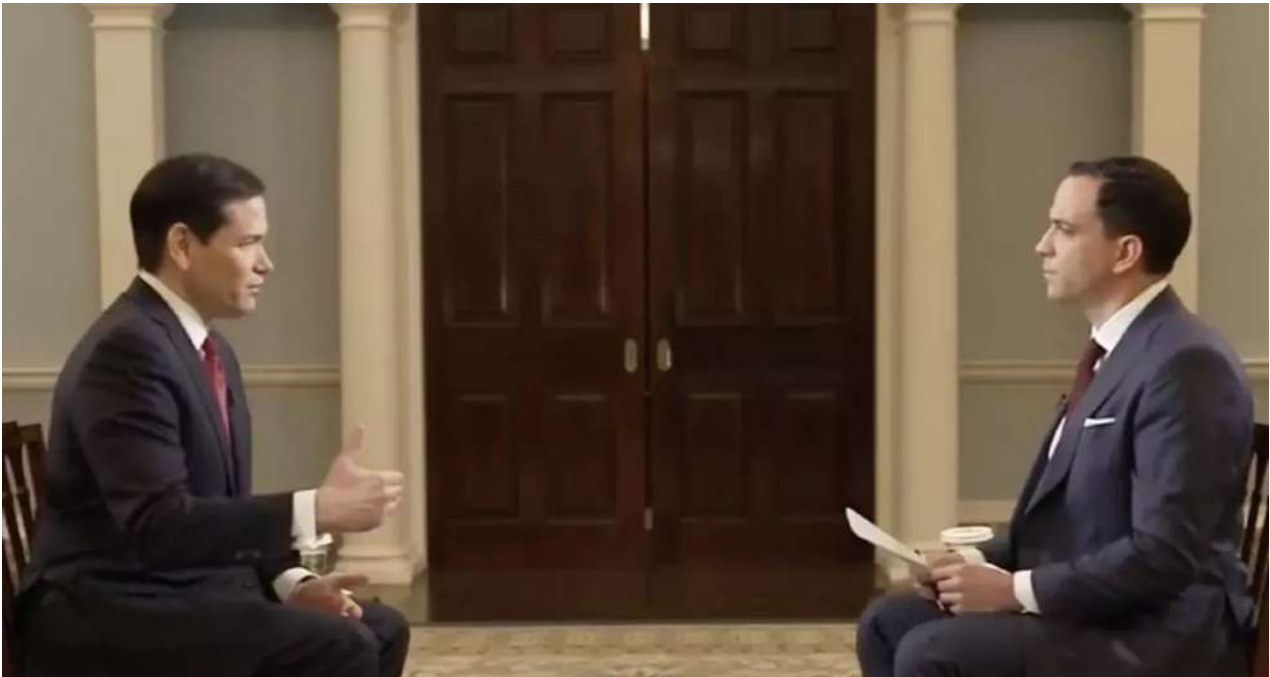
El secretario de Estado de EE UU, Marco Rubio, durante su entrevista para Fox News, este lunes.