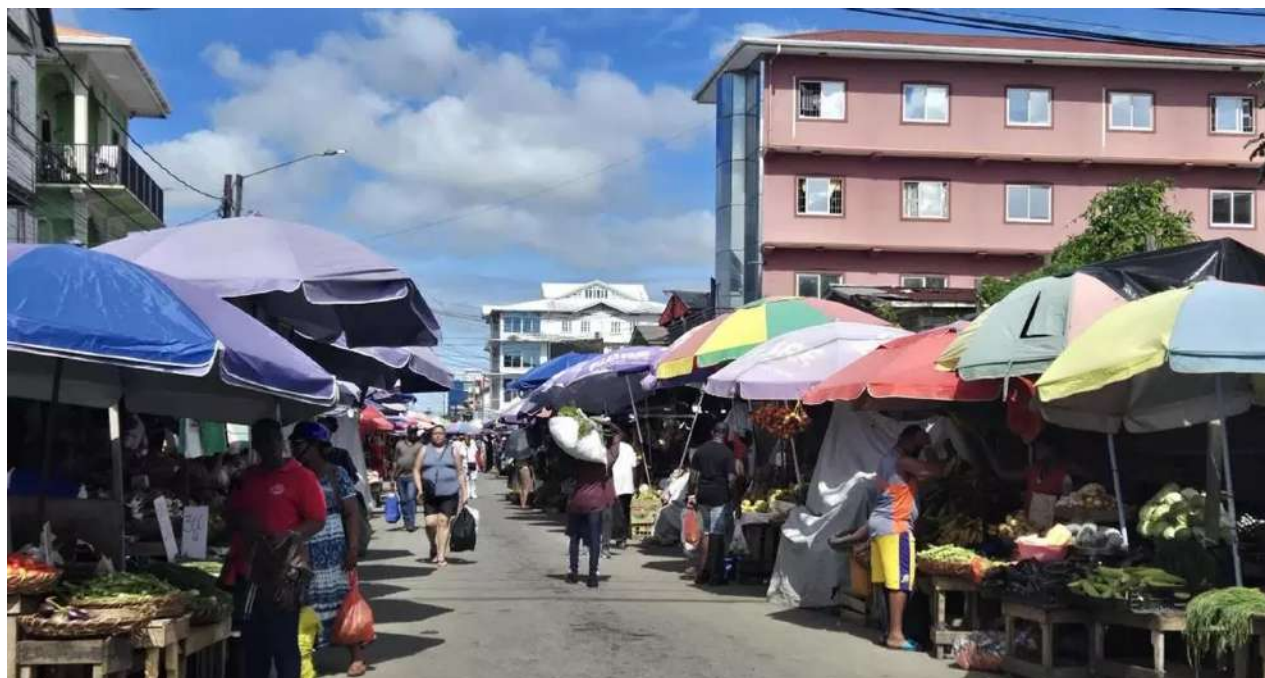
Puestos improvisados de alimentos en el Mercado Municipal de Bourda, en Georgetown (Guyana).