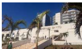
EL SUPERMERCADO DE 3RA Y 70 ESTÁ MEDIO VACÍO