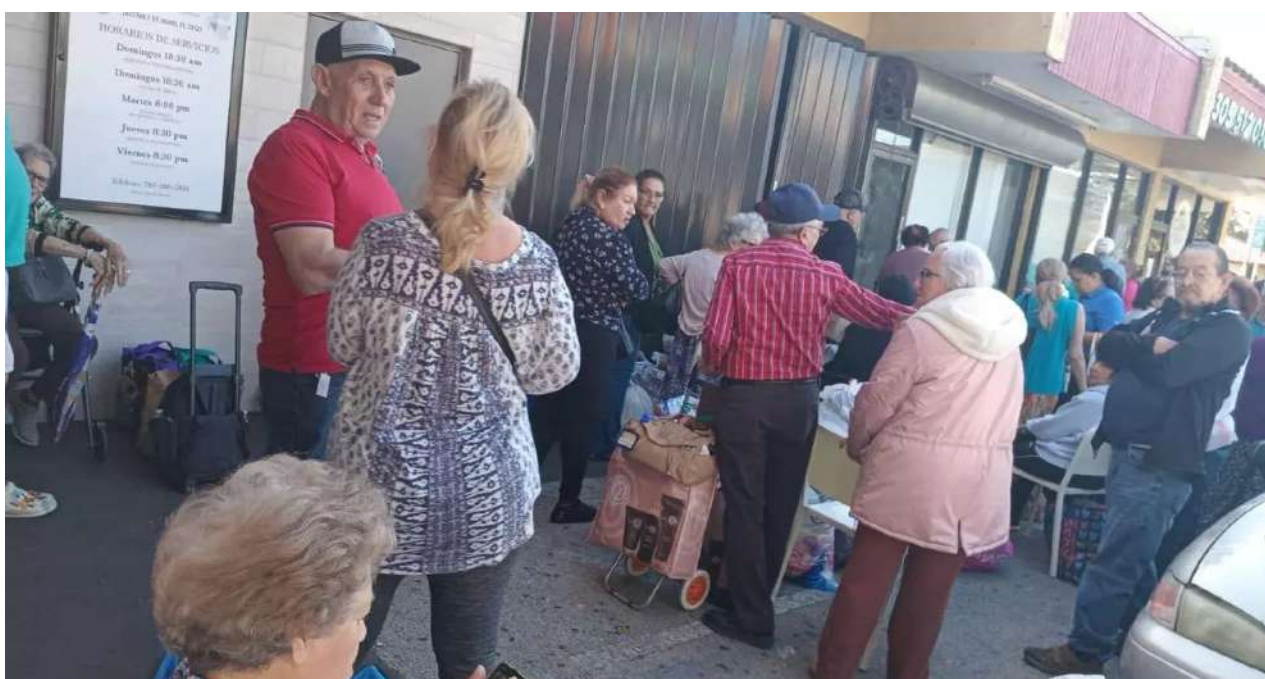
Cubanos en Miami intentando hacer envíos a sus familiares en la Isla.

Una selección con lo mejor de la semana del primer diario independiente hecho en Cuba