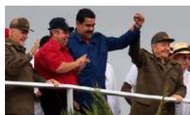
VENEZUELA SE 'DESCUBANIZA' RÁPIDAMENTE