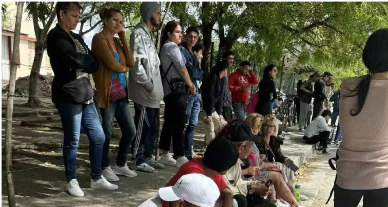
Personas congregadas ante el tribunal de Holguín, este jueves.