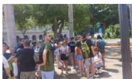
CANCELAN LOS VUELOS DE CANADÁ A CUBA