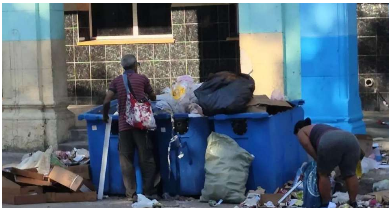
Buzos registrando en la basura, en La Habana.