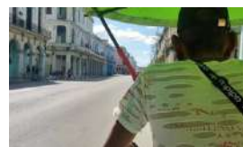
CUBA Y LA HORA DE QUITARSE LAS MÁSCARAS