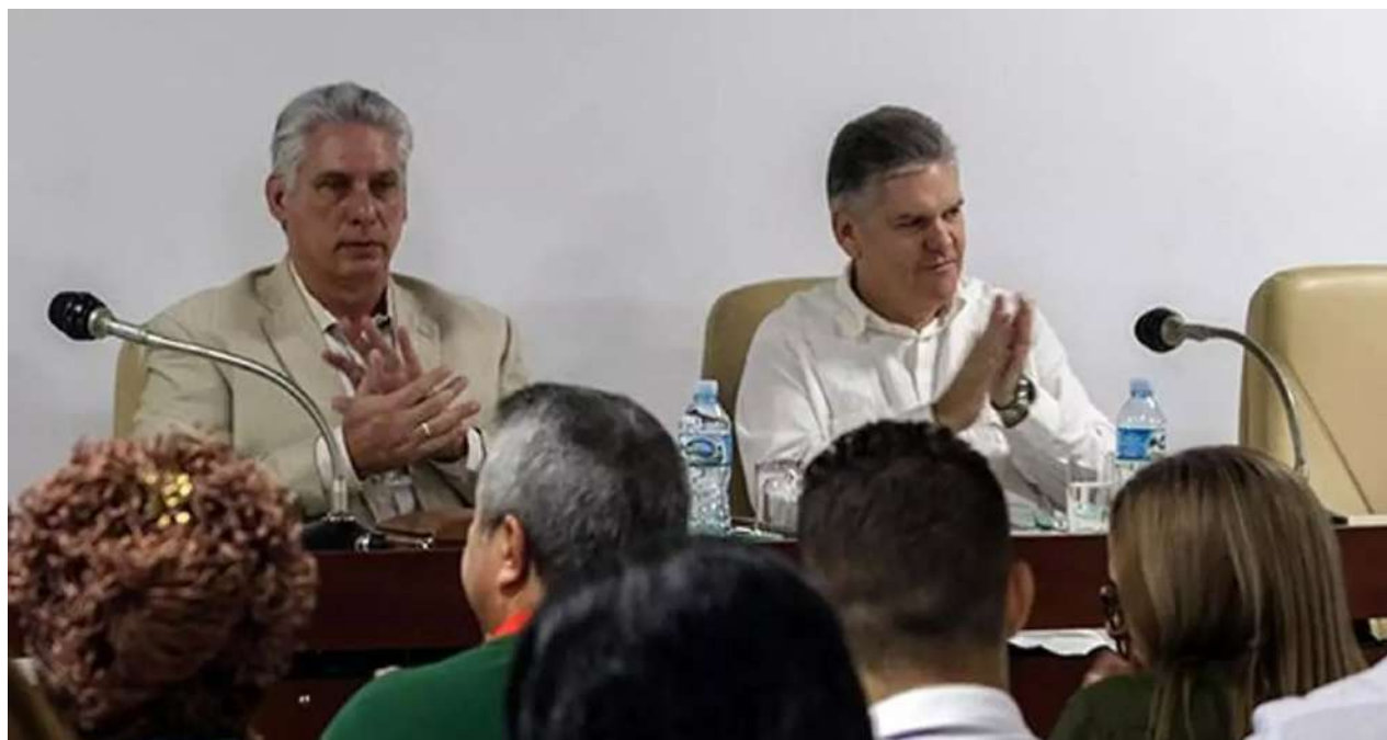
Miguel Díaz-Canel y Alejandro Gil, entonces ministro de Economía, en una imagen de 2019.