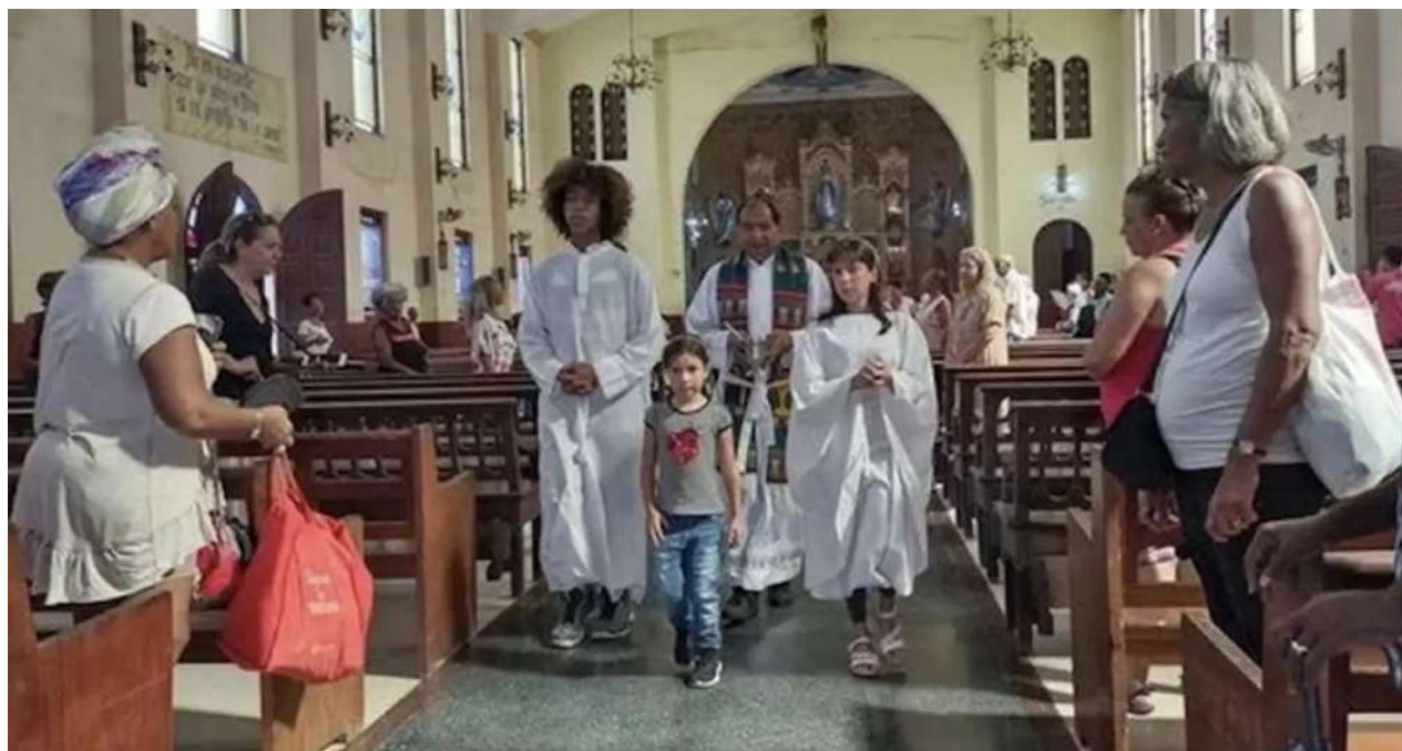
Interior de la iglesia de La Milagrosa, en el barrio habanero de Santos Suárez.