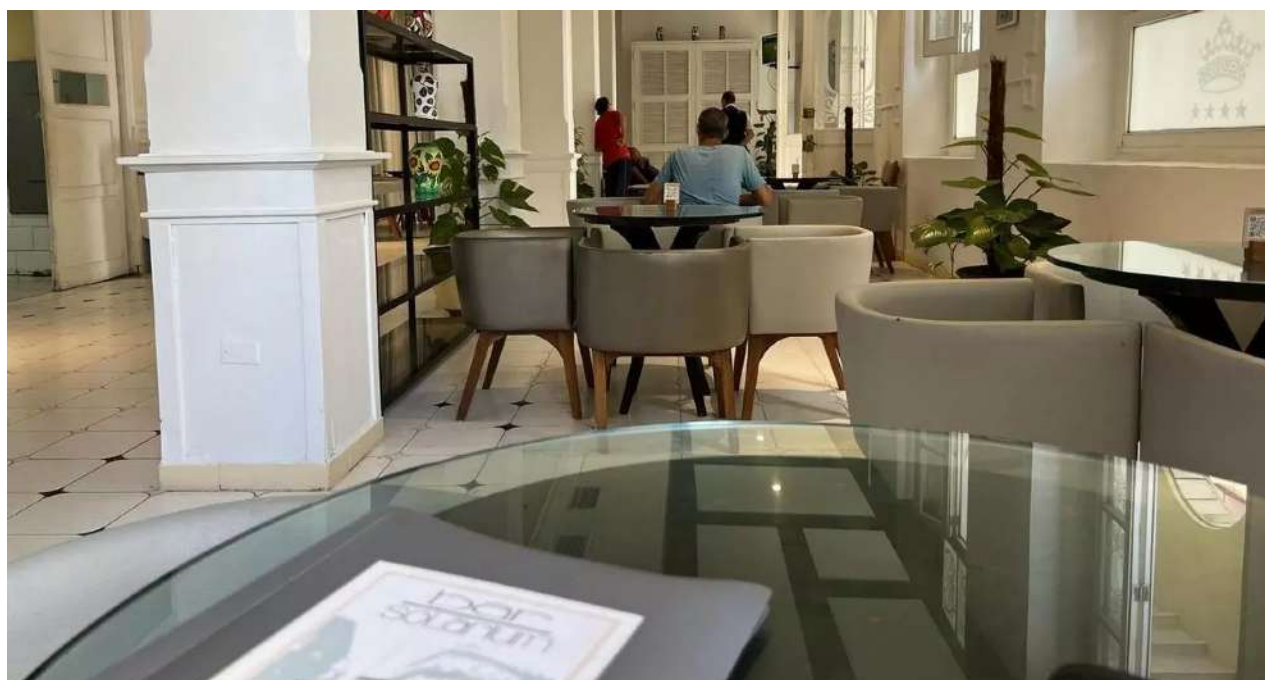
Bar Solarium del Hotel Plaza, en La Habana.