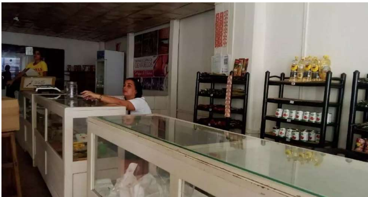
Comercio privado en la ciudad de Cienfuegos.

Una selección con lo mejor de la semana del primer diario independiente hecho en Cuba