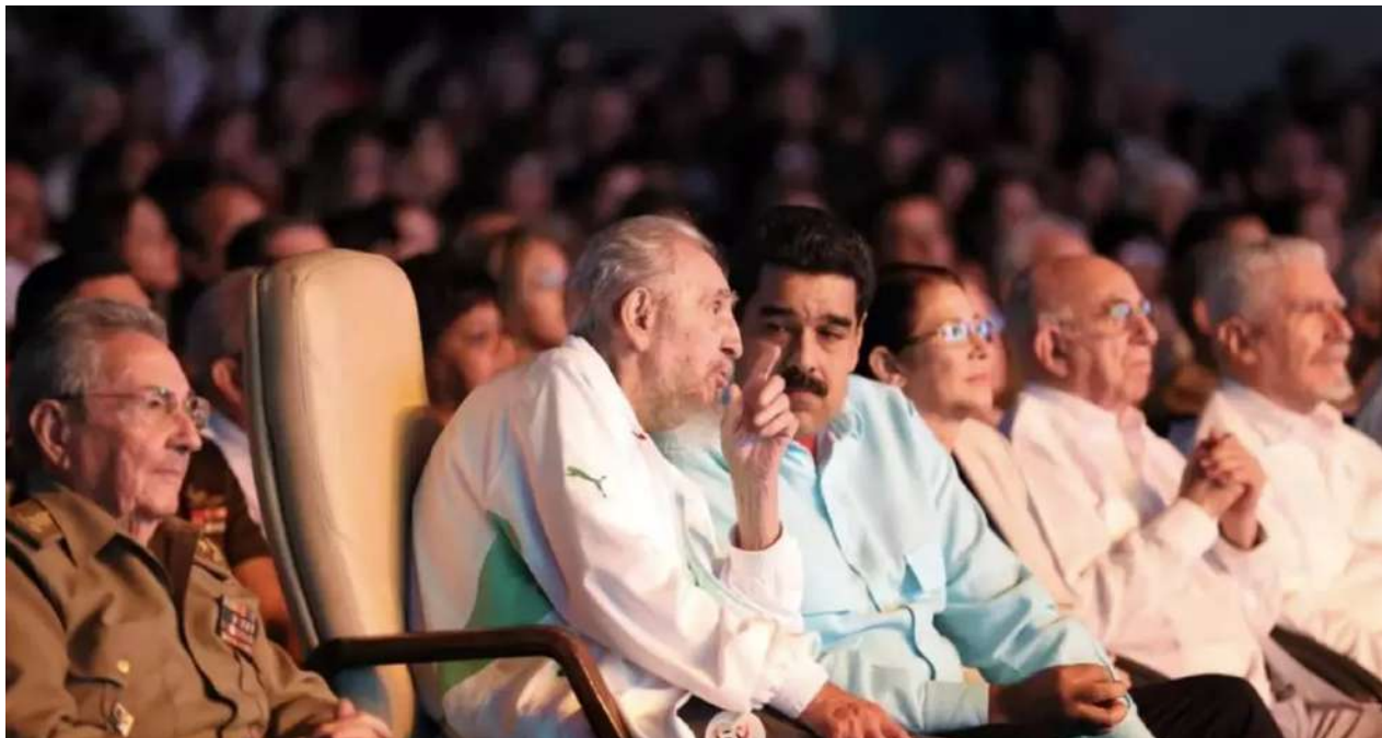
Nicolas Maduro con la cúpula del régimen cubano, en el 90 aniversario de Fidel Castro.