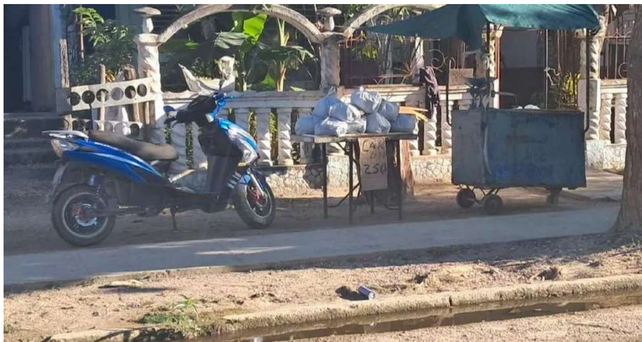
Bolsas de carbón listas para cambiar de manos por 250 pesos cada una.