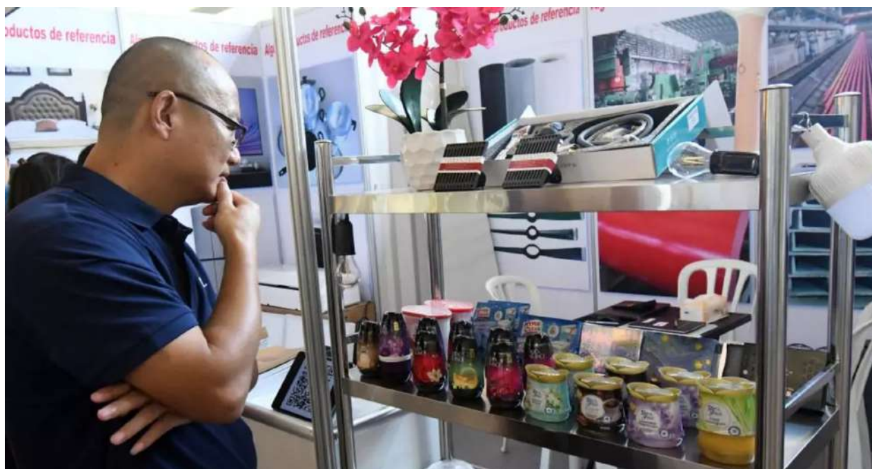
Stand de productos chinos en la Fihav de 2025.