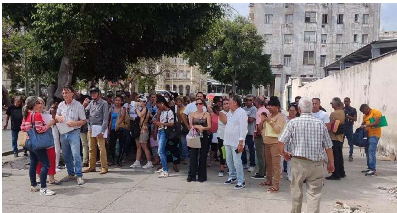
Las colas en la embajada de España en Cuba han sido constantes de que se inició el proceso.