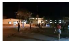
"COMIDA Y CORRIENTE", PIDEN LOS CUBANOS