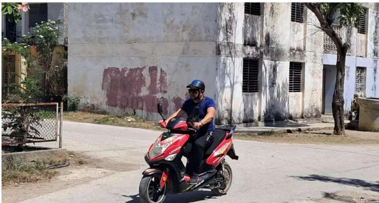
Pese a su aspereza visual, el reparto Lenin parece un oasis urbanístico comparado con las barriadas que lo rodean.

Una selección con lo mejor de la semana del primer diario independiente hecho en Cuba