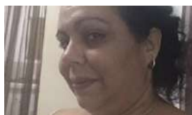
EE UU DEPORTARÁ A LA JUEZA CUBANA CON 'PAROLE'