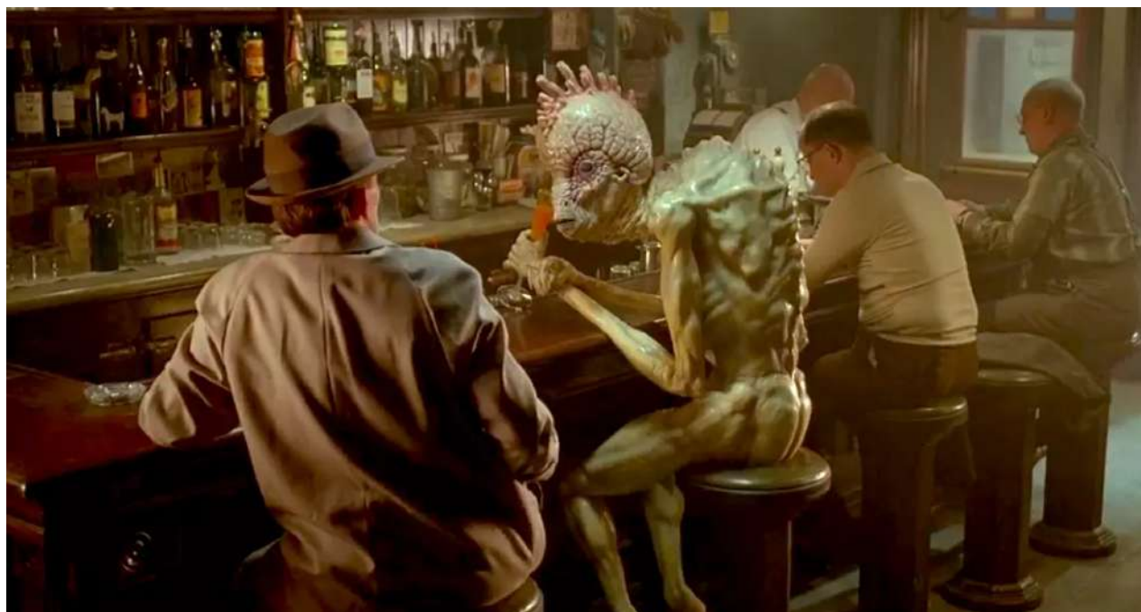
Fotograma de Naked Lunch (1991), el filme de David Cronenberg basado en la novela de William Burroughs.