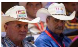
LOS GUAJIROS TENDRÁN DÓLARES CON CONDICIONES