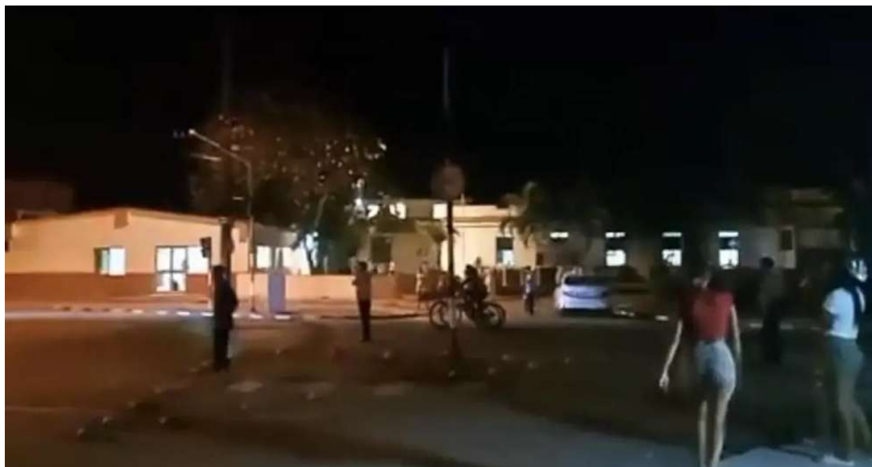
Imagen de uno de los videos compartidos en redes mostrando la protesta del miércoles en Bayamo, Granma. / Captura