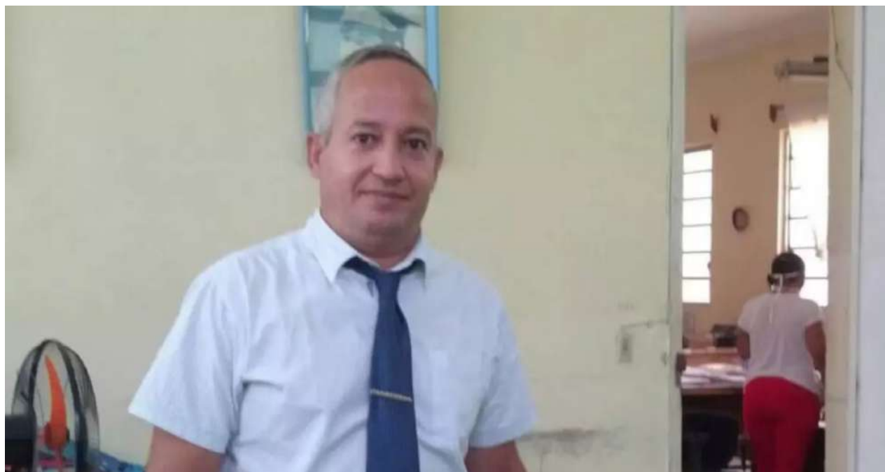
Amalio Alfaro Matos, ex presidente de la Sala de lo Penal del Tribunal Provincial Popular de Guantánamo, en una imagen de archivo.