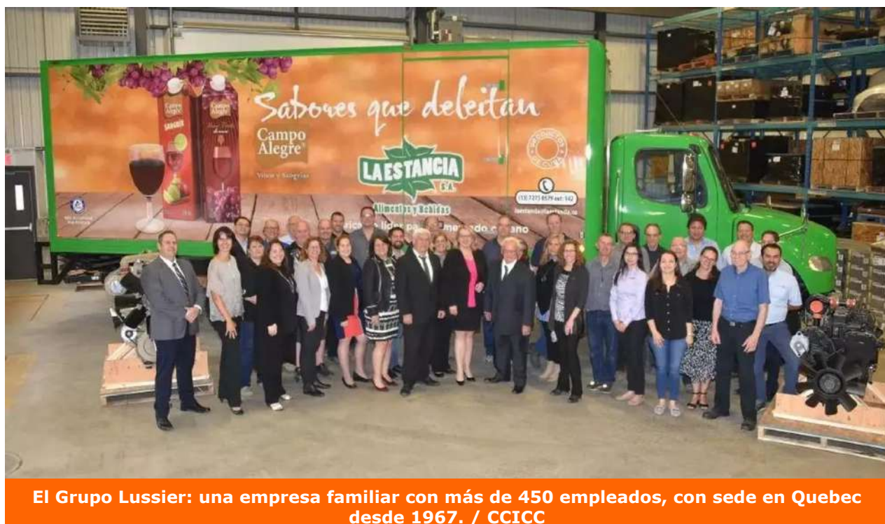
El Grupo Lussier: una empresa familiar con más de 450 empleados, con sede en Quebec desde 1967. / CCICC