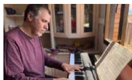
"TUVE QUE IRME, COMO MUCHOS CUBANOS"