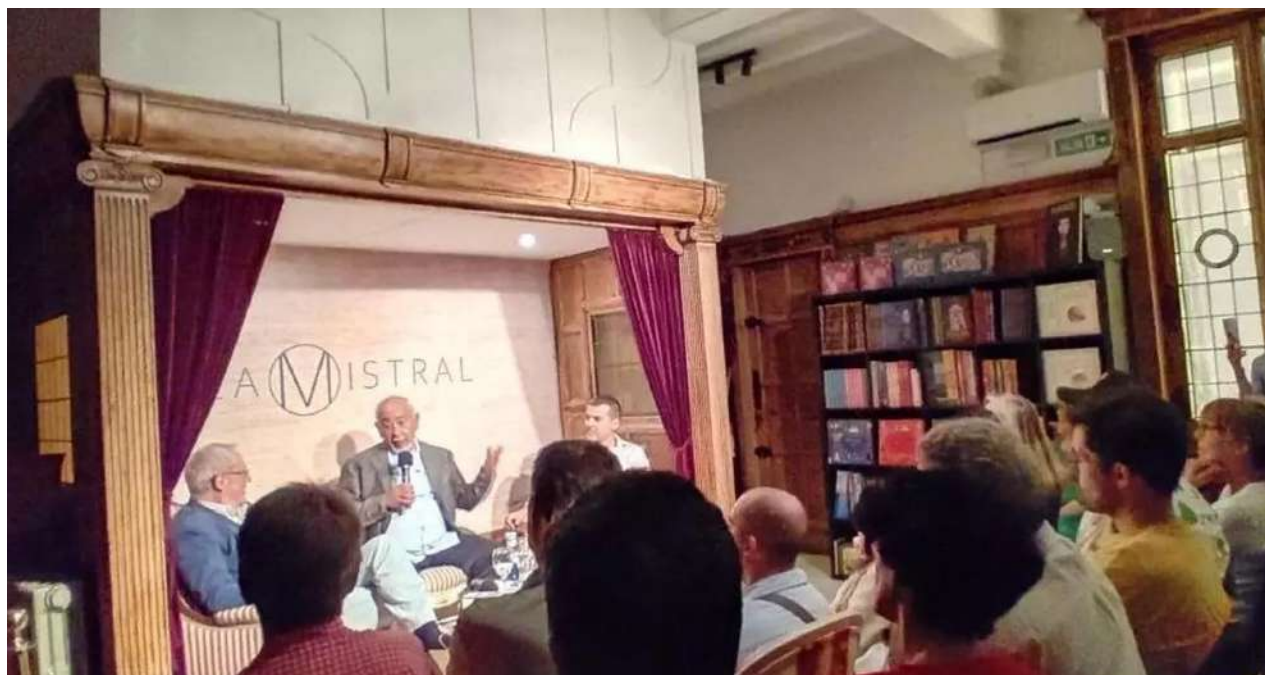
Leonardo Padura presentó su libro este miércoles en La Mistral, a pocos metros de la Puerta del Sol de Madrid.